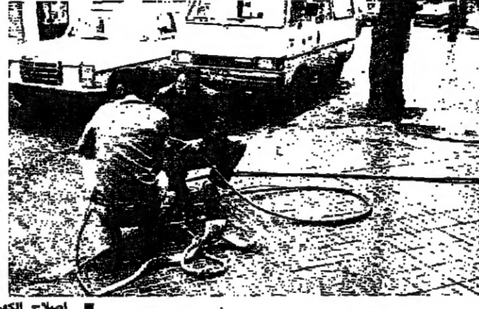
سوق عيشة بكر